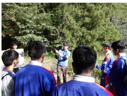
当園のイシガメレクチャー