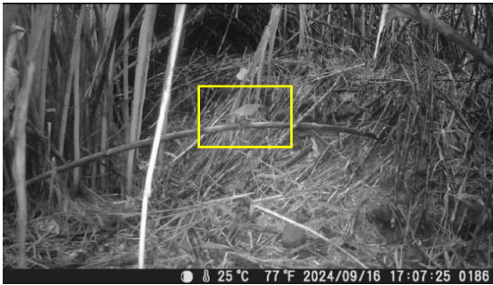
ウチヤマセンニユウ