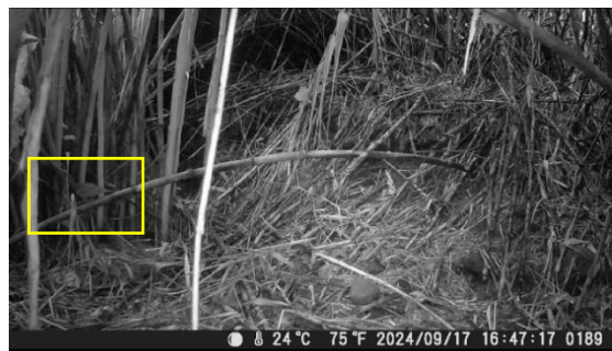
ウチヤマセンニユウ