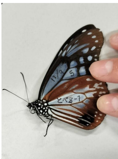
11/9 S とべ Z-1