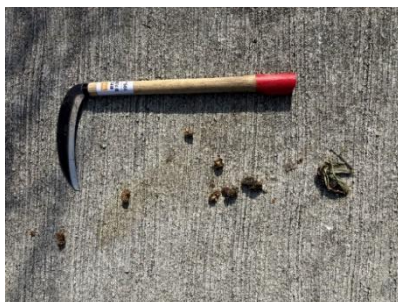
植物の種が入った動物の糞

調査地点周辺の探索調査では、ニホンカワウソの生息に関わる痕跡は見られなかった。動物の糞も見られたが植物の種などが含まれており、ハクビシンのものであると判断した。地元住民への聞き取りでは、約30年前に調査地周辺の磯にカワウソの糞らしき動物の糞を見たという証言が得られた。