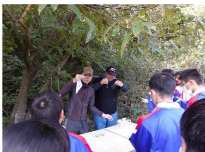
畠中氏による水生生物のレクチャー