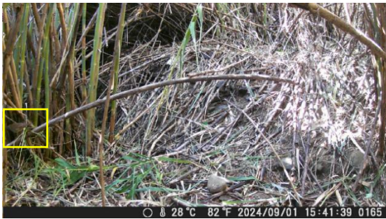
ウチヤマセンニユウ